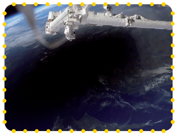
Der Mondschatten vom 12.03.06 von der ISS aus betrachtet