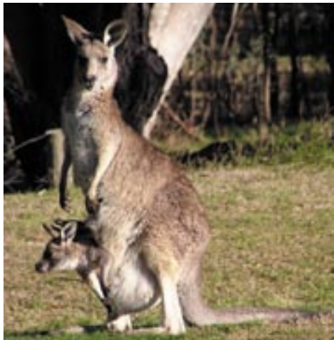
Östliches Graues Riesenkänguru

Mit einem halben Jahr verlassen sie zum ersten mal den Beutel und mit