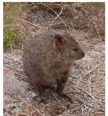
Quokka, auch eine Känguruart