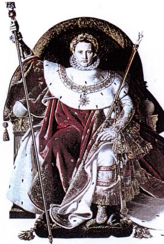
1804 Napoléon empereur. Tableau d'Ingres, musée de