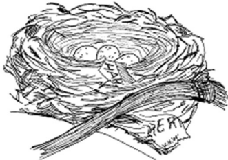
Nest einer Amsel