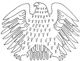
Der Bundesadler hängt im Bundestag